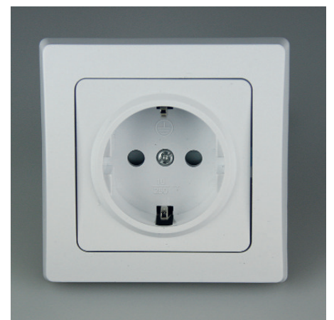
Art.-Nr. 19716: Schutzkontakt-Steckdose • 230V / 16A • inkl. Rahmen • mit Einsteckschutz