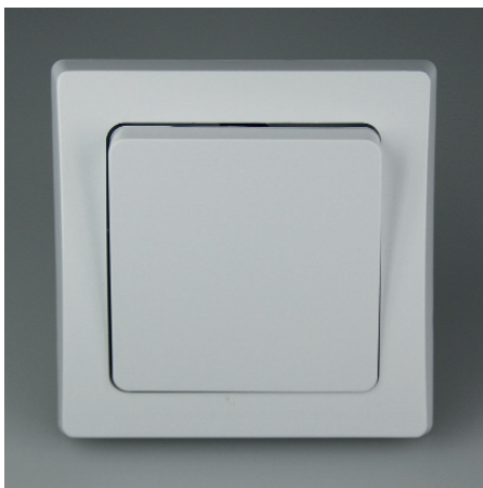
Art.-Nr. 19717: Wechsel-Schalter • 230V / 10A • inkl. Rahmen