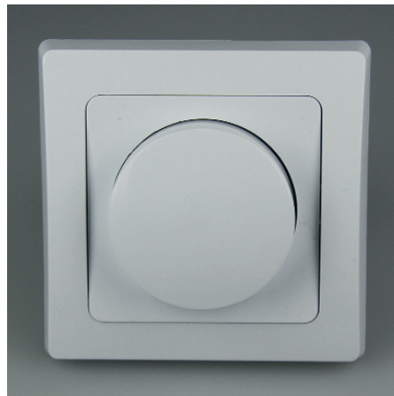
Art.-Nr. 19721: Dimmer für elektr. Trafos • 230V / 300W • inkl. Rahmen • Sicherung 250V~/2A