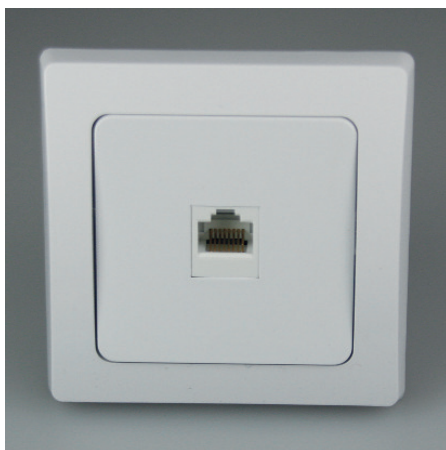
Art.-Nr. 19722: RJ45 Dose für ISDN & Cat.5 • Telefon oder Netzwerk