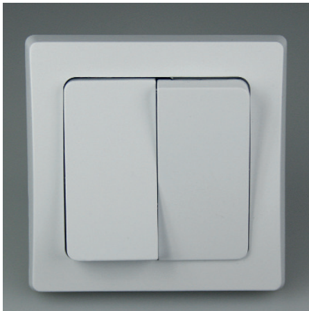
Art.-Nr. 19718: 2-fach Serien-Schalter • 230V / 10A • inkl. Rahmen