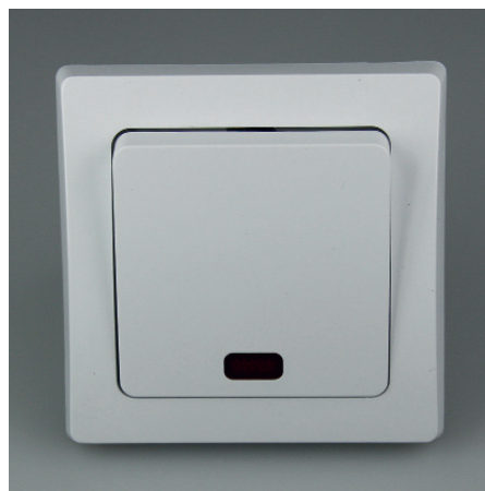
Art.-Nr. 19719: Kontroll-Schalter • 230V / 10A • inkl. Rahmen • mit Kontrollleuchte