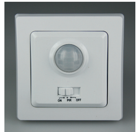
Art.-Nr. 19720: Bewegungsmelder • 230V / 400W • inkl. Rahmen • Sicherung 250V~/2A