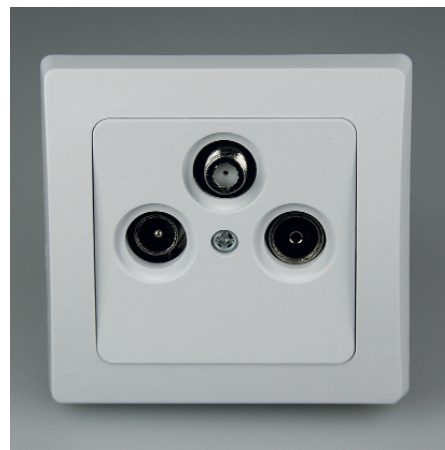
Art.-Nr. 19723: Antennendose TV+Radio+Sat • Kabel, Terrestrisch u. Sat