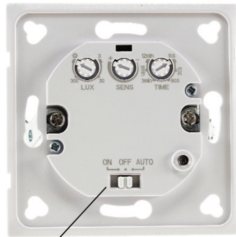
Ein / Aus / Auto Auto= Bewegungsmelder aktiv