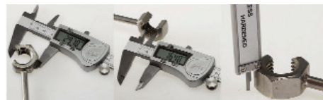
Länge außen Länge innen Tiefe